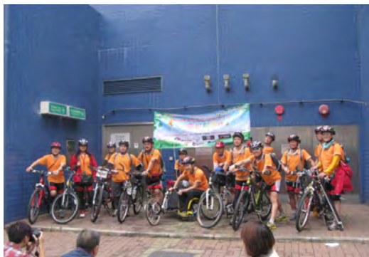
《踏出毅歷行》傷健共融單車活動 2011