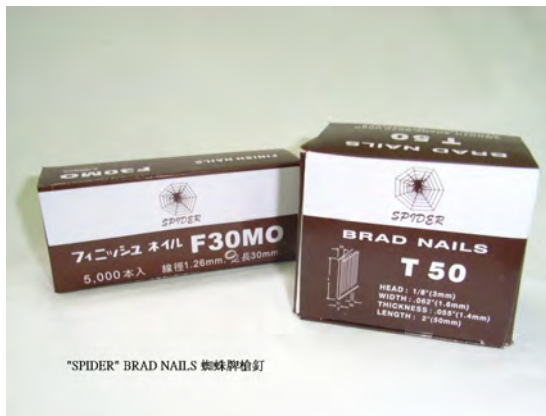
"SPIDER" BRAD NAILS 蜘蛛牌槍釘