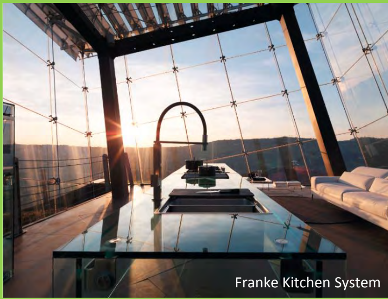
Franke Kitchen System