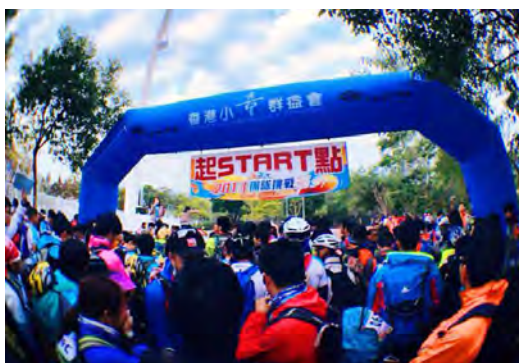
《團隊挑戰 36》越野慈善賽 2013

未來，藝高將繼續鞏固及完善現有的營銷網路，積極優化各分銷管道；以及增設更多自家銷售點及開拓外國銷售點，以強化品牌形象。