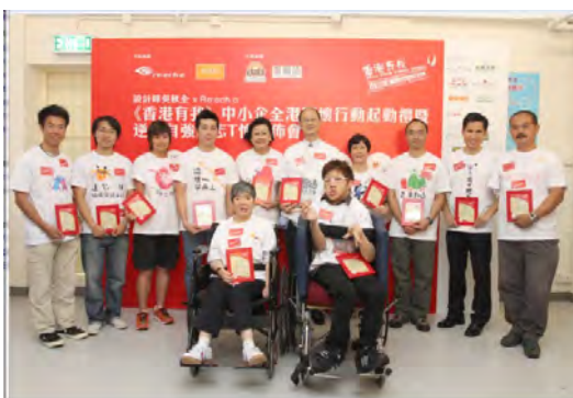
《香港有我》T恤義賣籌款 2009