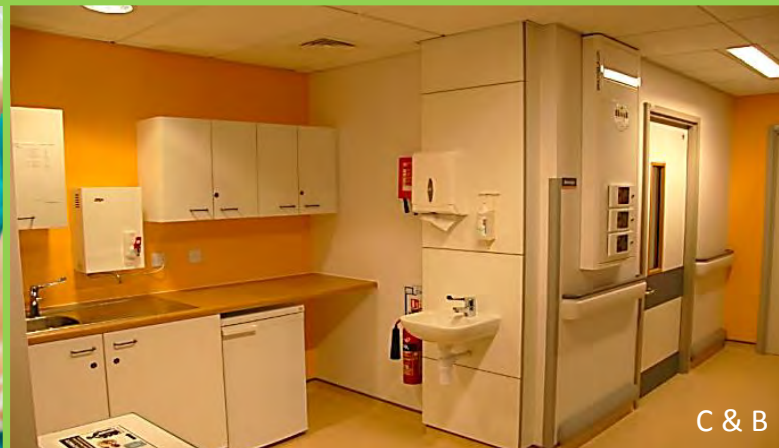
C & B