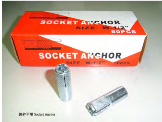
鍍鋅平螺 Socket Anchor