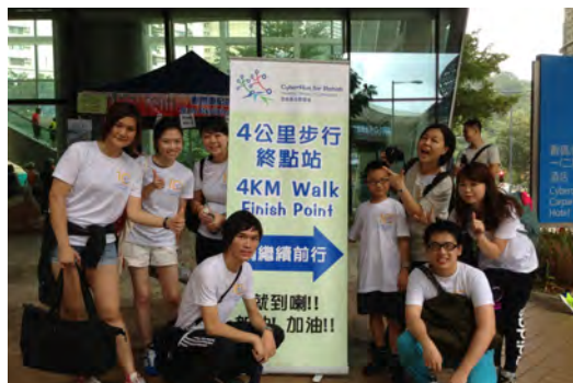
與員工參與健康萬步數碼港步行籌款