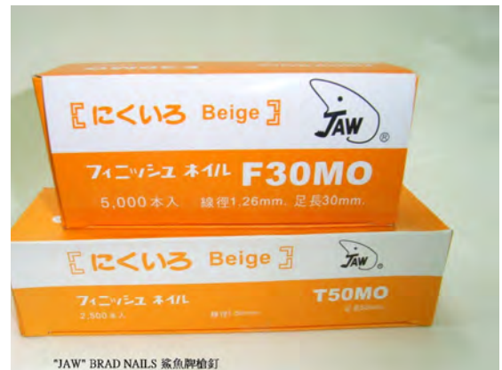
"JAW" BRAD NAILS 鯊魚牌槍釘

地址：新界屯門天后路 18 號 南豐工業城 第五座 地下 1 室 電話：(852) 2720 5717 傳真：(852) 2464 3781 電郵：hopping186@yahoo.com.hk