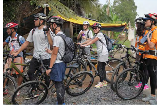
2012 年《Reecho》全體員工到越南考察

在經營零售業務方面，藝高從顧客的觀點出發貫徹實施「體驗式」理念。位於油麻地的戶外用品專門店稱為《Reecho 體驗館》，內部裝置都以第一身體驗產品特色來設計，如特製不同材質的地面以供試穿跑鞋、露營專區提供特製木床給客人親身試用地蓆、睡袋以及其他功能戶外用品。這可實際地配合顧客的需要以提升用家對產品質量的信心，更提供了一種獨特新鮮的購物體驗給顧客，令品牌形象更具體化。此外，自推出會員制度以來已招收多達 7000 名會員，透過不同類型的免費活動平台，可有效而直接地與終端顧客交流公司產品心得及收集對服務的意見。在未來日子，藝高會著意加強客戶關係管理。