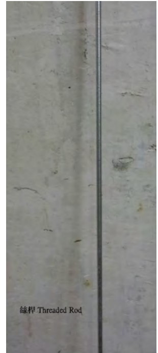
綠桿 Threaded Rod