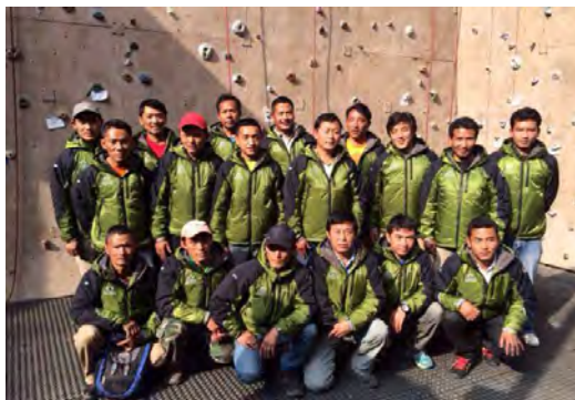
贊助尼泊爾登山隊以強化品牌的專業形象