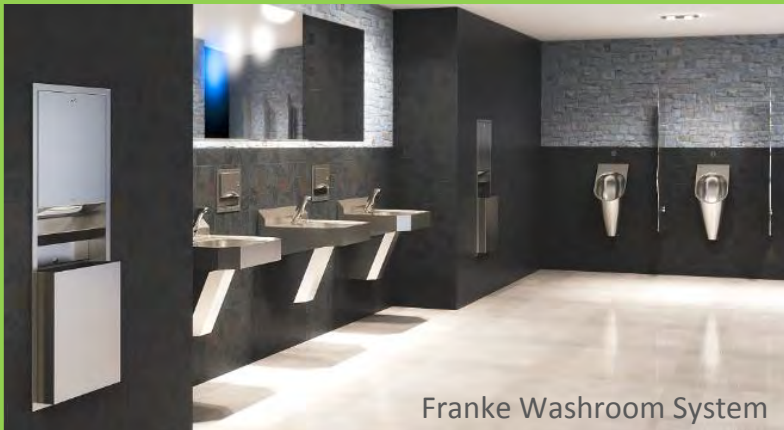
Franke Washroom System