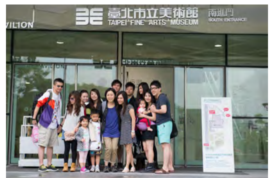
2014 台灣文化考察之旅