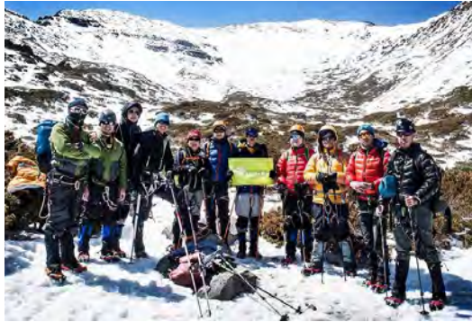
2013 年《Reecho》團隊參加台灣登山旅程