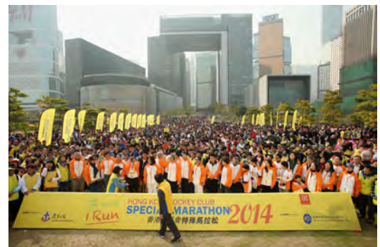
協助東華三院籌辦香港賽馬會特殊馬拉松